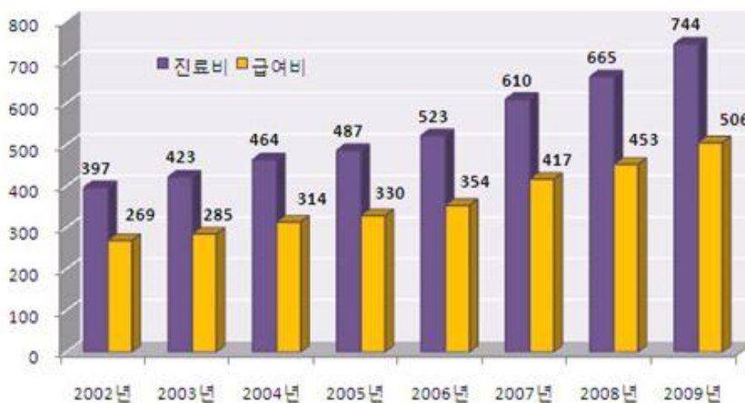
2002-2009년 변비질환(K59) 진료비 / 급여비 (억원)