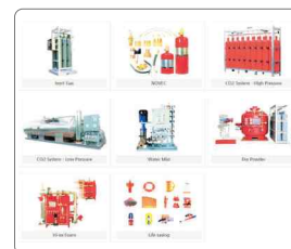
〈FIRE FIGHTING SYSTEM〉