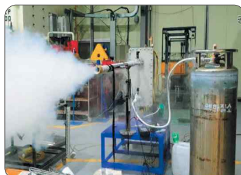
〈Vaporizer with BPHE LNG/LN2 기화기〉