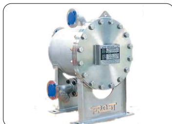
〈BSPHE 브레이징셸앤플레이트형 열교환기〉